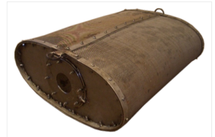
Filtros de Inox.