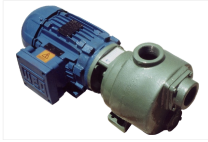
Bombas com motor a prova de explosão.