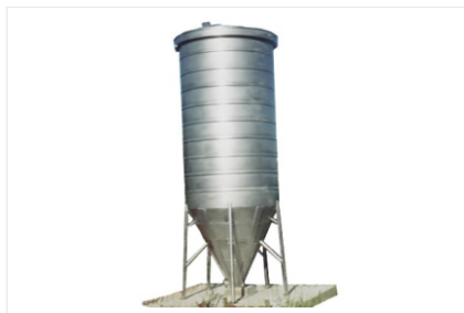
Decantadores de inox.