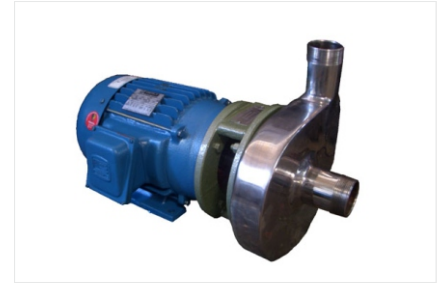
Bombas de chapa de aço Inox.