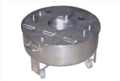
Recipientes de inox conforme projeto.