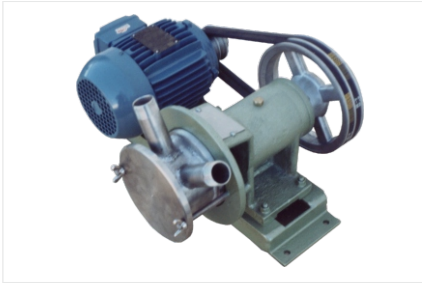
Bombas de Deslocamento Positivo.