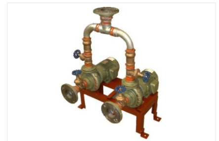
Bombas sobre base.