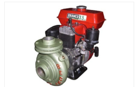
Bombas com motor a combustão.