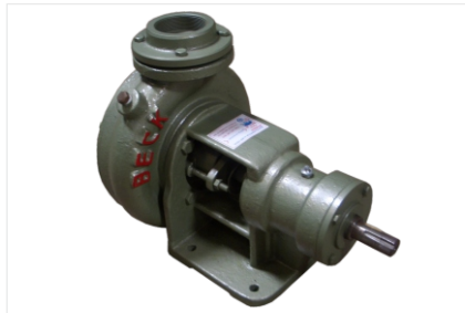
Bombas mancal suporte.